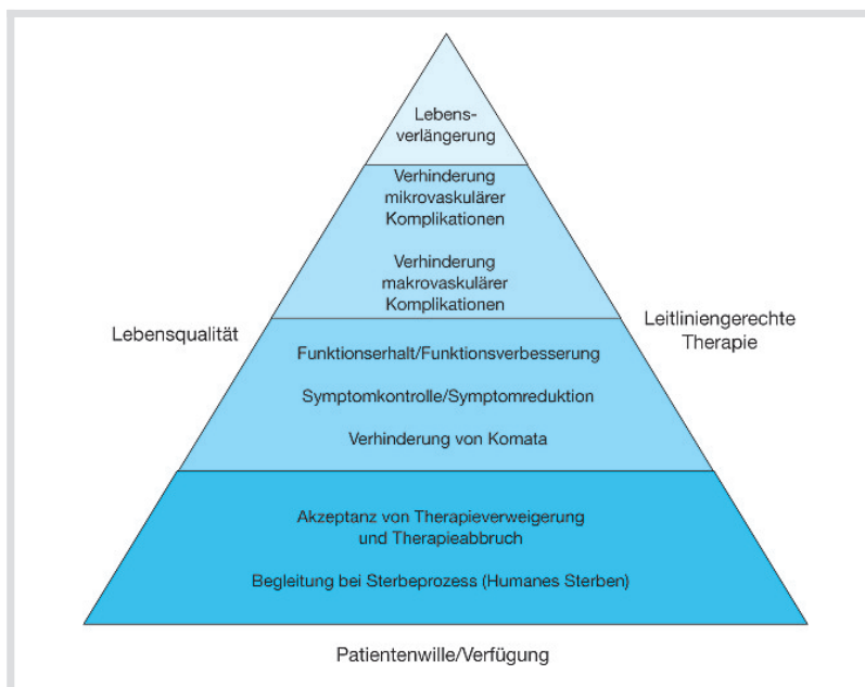
Abb. 1 Therapieziele unter Berücksichtigung besonderer Aspekte bei der Behandlung älterer Menschen mit Diabetes.